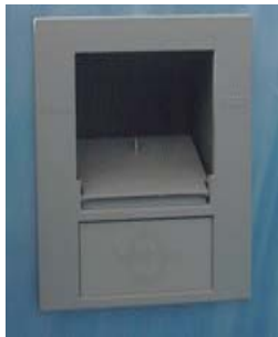
1/ El compartimiento del filtro forma parte del spa

Cada spa tiene su propio sistema de filtración instalado que se activa y controla por el ordenador de control. Dos veces al día el sistema de filtración se activara y comenzara a filtrar. Cuando el sistema de filtración comience se encienden todas las bombas y el soplador durante un minuto para mover el agua y suspender en ello cualquier residuo para que puedan ser filtrados. Durante la filtración el ozonador también se activara para matar cualquier tipo de bacteria restante.