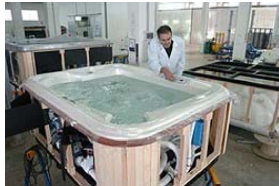
En el proceso de probar el spa este casco tiene todo el bastidor montado y es listo para montar los paneles