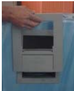
2/ Deslice la cubierta del filtro arriba y fuera