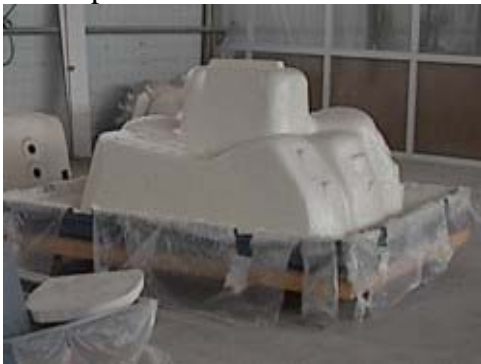
Aquí vemos la superficie después de aplicarle varias capas de poliéster.

al acrílico y están compuestas de poliéster que se endurece a ser increíblemente fuerte y resistente haciendo el casco del spa casi indestructible. Una de las zonas donde su spa debe de ser más fuerte es el borde. Láminas especiales están metidos entre las capas de fibra de vidrio para reforzar el borde de cada uno de Sunbelt spas. También se le añade un marco de madera para incrementar la integridad de la estructura. Una vez terminada el casco, se construye el bastidor del spa utilizando madera endurecida y otros materiales sintéticos para asegurar una larga duración y resistencia a los elementos y al paso del tiempo. Finalmente se le añade la base - hecho con materiales puramente sintéticos (ABS) y diseñado para mantener fuera agua, roedores, insectos y cualquier otro tipo de elemento que pueda dañar el spa.