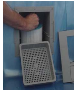
3/ Retire la bandeja desenrosca el filtro y después retirarlo

Si desea utilizar su spa mientras se realiza su ciclo de filtración no hay ningún problema ya que pulsando cualquier botón del mando de control el sistema de filtración se suspenderá mientras usted se baña y después recomienza su ciclo de filtración de nuevo. Una bandeja esta instalada en la parte superior del filtro para recolectar los objetos más grandes tales como hojas. El filtro esta hecho de papel plegado y se puede retirarlo del spa fácilmente para limpiarlo. El filtro se puede limpiar con una manguera o bien el filtro entero se puede poner en su lavavajillas. Con un uso normal los filtros duran en general hasta tres años antes de tener que cambiarlos.